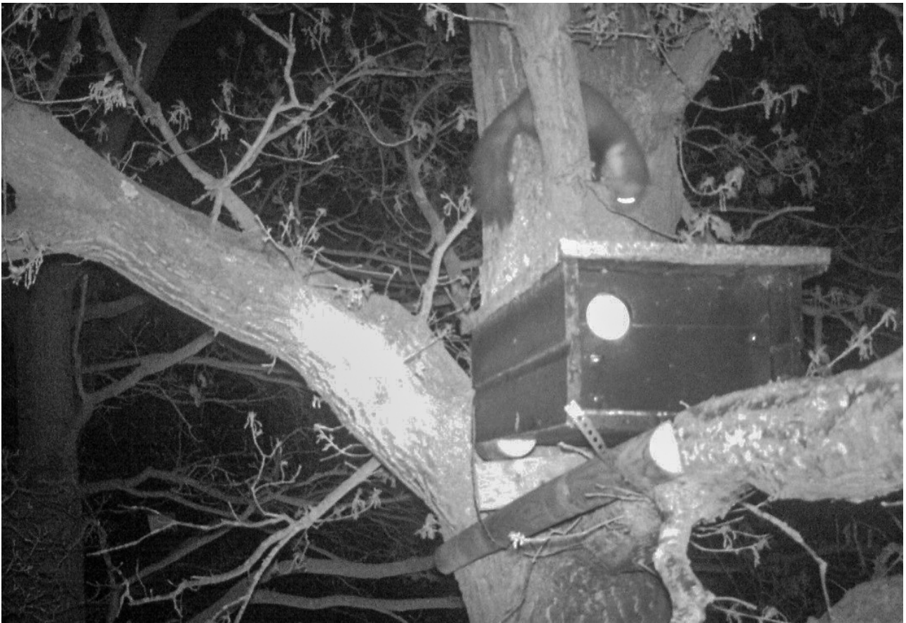
Steenmarter in de nacht bij een steenuilenkast.